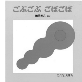
作：駒形克己 出版社：福音館書店

絵本の表紙を見せただけで、声をあげて笑い始める反応は興味深いものです。絵の形と色が、乳児自身にとって楽しいものであると認識しているからこそその反応であって、それはお気に入りのおもちゃに対するものとよく似ていま