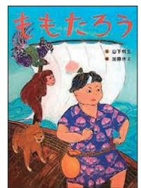
『ももたろう』山下明生 文 加藤休ミ 絵(あかね書房)