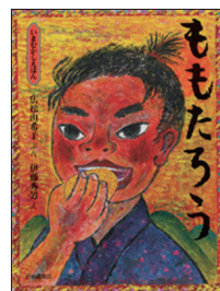
『ももたろう』広松由希子 文 伊藤秀男 絵(岩崎書店)

もうお分かりと思いますが、芸術的な絵画や色彩の絵本に多く触れてきた子どもは、かわいいアニメタイプの絵よりも、その物語をイメージしやすい写実的で落ち着いた色彩の絵を自ら選び、想像をより膨らませることができるのです。大人の勝手な子ども目線でアニメ版に頼らなくても、モノクロや水墨