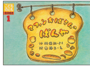
1981年 月刊「こどものとも」

「子どもの時に読んだ絵本で、パンを作っていると部屋の中にどんどん広がってパンだらけになる話があったのですが、何の本かわかりますか」というような、絵本のタイトルは覚えていないけれど内容を覚えていて、印象に残っている箇所を説明して絵本名を尋ねられるお父様お母様がいます。登場人物の特徴や物語の山場だけを覚えていて、その絵本にもう一度、出会いたいと希望されるのです。絵本の力はやはり底知れないと思います。20年、30年と触れていない絵本でも、その物語世界をたっぷり堪能して大きくなった大人は、ちゃんと記憶の片隅に棲