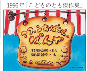
『マフィンおばさんのぱんや』竹林亜紀 作 河本祥子 絵(福音館書店)

みついているのですから。そして自分が親となってわが子と触れ合っているふとしたときに物語シーンがよみがえり、自分の楽しんだ世界へ子どもを招待しようとするのですから。