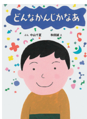
(*1) 中山千夏 ぶん 和田誠 え 自由国民社

世界が見開きで描かれているので、一緒に想像しながら読めるでしょう。 『たっちゃんぼくがきらいなのも(*2)も、ぜひ読んでほしい一冊。自閉症のたっちゃんぼくと手をつないでくれないし、ふしぎな言葉をしやべる…。子どもの「どうして？」に答える形で、自閉症児の特徴をやさ