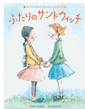
(*3) さく ラーニア・アル・アプドラー ぶん ケリー・ディブキオ え エリシャ・トッッサ TOブックス

世界が見開きで描かれているので、一緒に想像しながら読めるでしょう。 『たっちゃんぼくがきらいなのも(*2)も、ぜひ読んでほしい一冊。自閉症のたっちゃんぼくと手をつないでくれないし、ふしぎな言葉をしやべる…。子どもの「どうして？」に答える形で、自閉症児の特徴をやさ