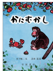
『かにむかし』 木下順二 文 清水崑 絵 (岩波書店)

なものだ」と述べています 5) 。とりわけ、木下順二氏が熊本弁で語る『かにむかし』を絶賛しています。『かにむかし』の原話は佐渡に伝承される昔話ですが、それをわざわざ熊本弁で再話したのは、「いきいきとしたイメージと語感で木下氏が口にできる語りことばが、暮らしの中で積み重ねた愛着のある熊本の土地ことばにあったからではないか」と推察しています 5) 。時代を超えて出現した「方言コスプレ」の研究においても木下文学に注目しており、「非“純粋日本語”としての〈田舎ことば〉をめざして造形したもの」とされていることから、『標準』からの『異化作用』を狙ったものがある」と分析しています 1) 。