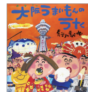
『大阪うまいものうた』 長谷川義史 作 (佼成出版社)

関西弁にはイメージが備わっていて、創作物に蓄積される「方言ステレオタイプ」の形成過程が明かされているのはその関西弁だけで、他はあまりわかっていないと日本語学者の田中ゆかり氏は示しています。ステレオタイプとは、「特定のことばづかいから、特定の人物像が思い浮かぶこと」で、その逆の「人物からことばづかいが思い浮かぶこと」も指し、大阪弁・関西弁では「冗談好き、けち、食通、派手好き、好色、根性、やくざ」の七つの「役割語」に集約されると提示しています 1) 。絵本の場合は、専ら「冗談、笑い」と「食通、食いしん坊」、「派手」がメインでしょう。