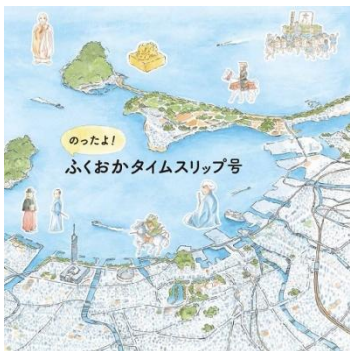
『のったよ！ふくおかタイムスリップ号』

岩永真一 文 蒲池智美 絵 「ふくおかのれきし絵本プロジェクト実行委員会」発行より