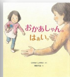
『おかあしゃん。 はい。』 くすのきしげのり 作 岡田 千晶 絵 佼成出版社より