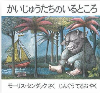
モーリス・センダック さく じんぐうてるおやく

「1 しゅうかん すぎ、 2 しゅうかん すぎ、 ひとつき ふたつき ひがたつて、 1ねんと1にち こうかいすると、 かいじゅうたちのいるところ」