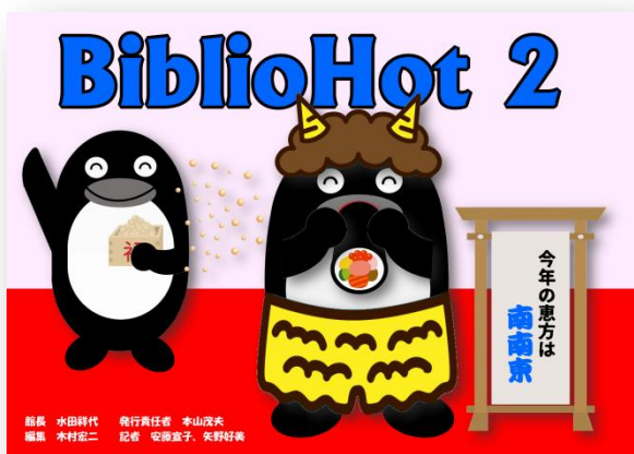
編集 水田祥代 発行責任者 本山茂夫 編集 木村宏二 記者 安藤直子、矢野好美

☆ペンギンクイズ 南アメリカ西岸を深く流れる海流に由来する名前のペンギンは、何ペンギンでしようか？