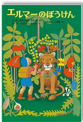
『エルマーのぼうけん』

飾り山の準備が行われ、「オイサー！」の掛け声で賑わう7月からやってきました。今年も、追いつ山の翌日16日からアジア美術館で「エルマーのぼうけん展」が開催されます。アメリカ・ミネソタ大学図書館のカーラン・コレクシヨンが所蔵する100点以上の貴重な原画が日本で初めて公開され、福岡へもやってきます。どうぶつ島にとらわれたりゆうの子や、その家族を助けようとする冒険の旅へ出かける9才の少年エルマーが、怖い動物や不思議な病気に遭うたび知恵を絞って乗り越えていく物語の3部作をハラハラしながら何度も読みあつたものです。原画の絵の美しさや質感は、「ほんものに触れることの大切さ」を教えてくださいませ。ワニの背中をジャンプして、空いろ高原で16びきのりゆうに出会い、空飛びりゆうを探して、りゆうの子を抱きかかろう冒険へ親子でこの夏は出かけてみませんか。