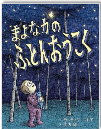
『まよなかのふとんおうこく』 ランディス・フレア 作 大友剛 訳 瑞雲舎