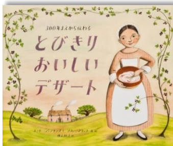
『300 ねんまえから伝わる とびきりおいしいデザート』 エミリー・ジェンキンス 文 ソフィー・ブラッコール 絵 横山 和江 訳 あすなる書房

さて、そんな今日は、300年ほど前、イギリスのライムという町で搾った牛の乳からクリームをすくい、小枝を紐で束ねたものでクリームをかき混ぜ作られた「ブラックベリー・プールの」が、2000年ほど前、アメリカのサウスカロライナ州でどう作られ、1000年くらい前、マサチューセッツ州のボストンではどのように作られ、何年前か前、アメリカのサンティエゴという町ではどのように作られるようになったのか、4つの家族による4つの物語を道具の進化や生活様式の変化をすばやく見抜く子どもたちと読みあっています。